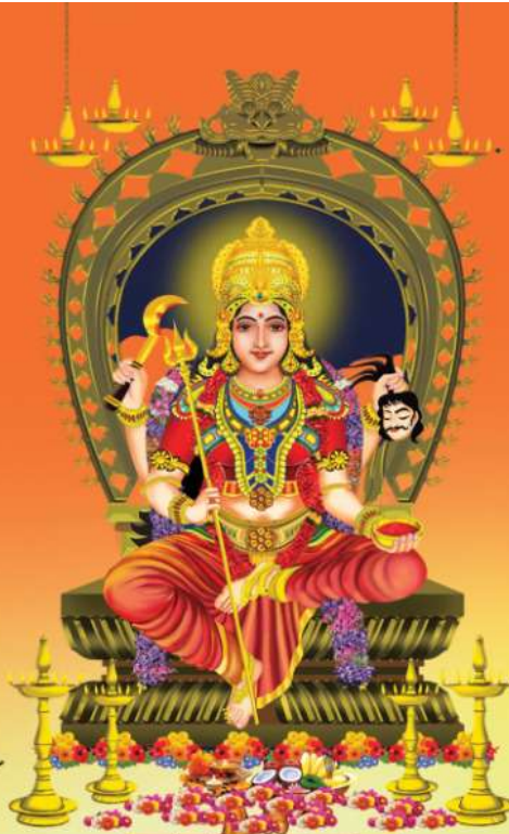
പായിപ്പാട് ശ്രീ പുത്തൻകാവിലമ്മ